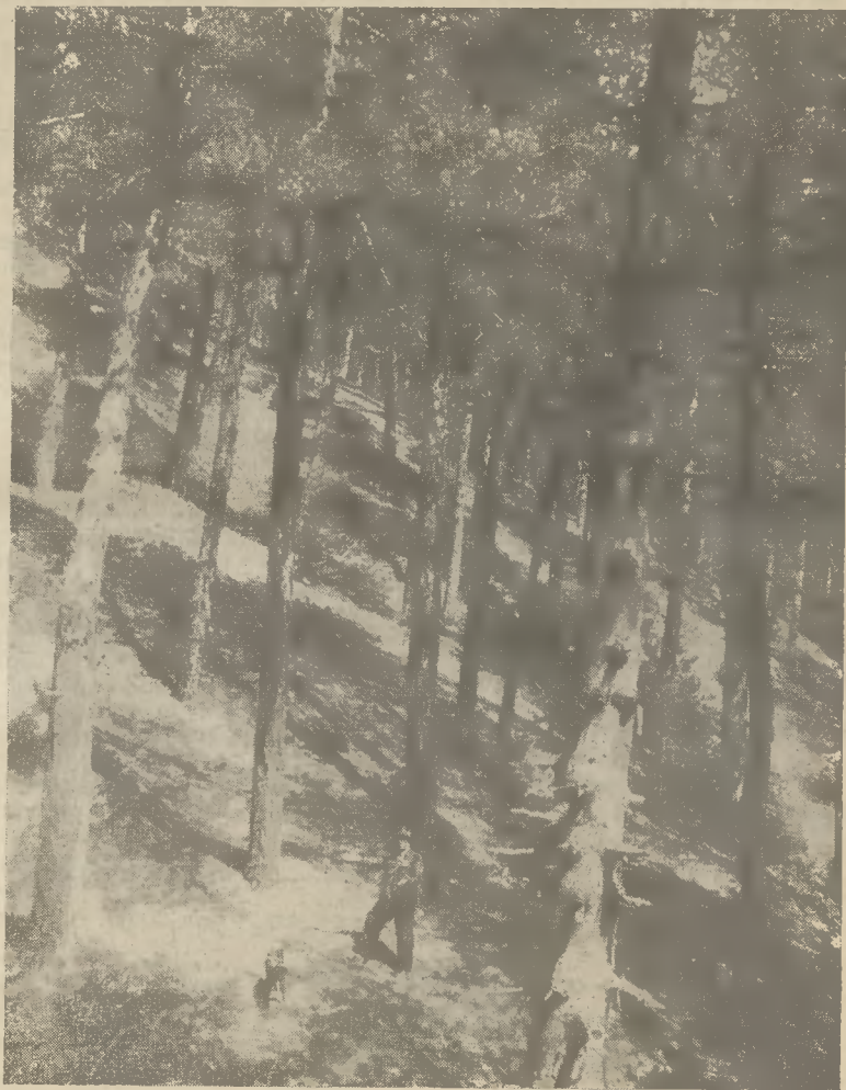
Τὸ δάσος τῆς Ἀλαγωνίας

Sic transit... Κατεβαίνομε μὲ τὸ ἡλιοβασίλεμα, μὲ σφιγμένη καρδιά καθὼς τὰ βήματα μονάχα ταραζοῦν τὴ νεκρικὴ ἡσυχία τῆς ἄλλοτε πολυθόρυβης ἀρχοντοῦπολης καὶ μελαγχολικὰ φιλοσοφοῦμε γιὰ τὴν ἐγκοσμίαν τὴν ματαιότητα... Τὸ κλάξον τοῦ αὐτοκινήτου μᾶς βγάξει ἀπ' τὴν ὄνειροπόλησίν μας.