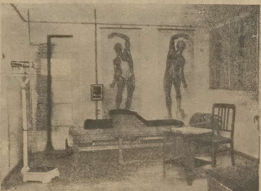
Μία ἀποψὶς τῆς μικρῆς αἰθούσης μηχανοθεραπείας καὶ ἐξετάσεων.