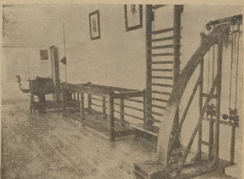
Μία ἀποψὶς τῆς μεγάλης αἰθούσης μηχανοθεραπείας καὶ ὀπλομαχητικῆς