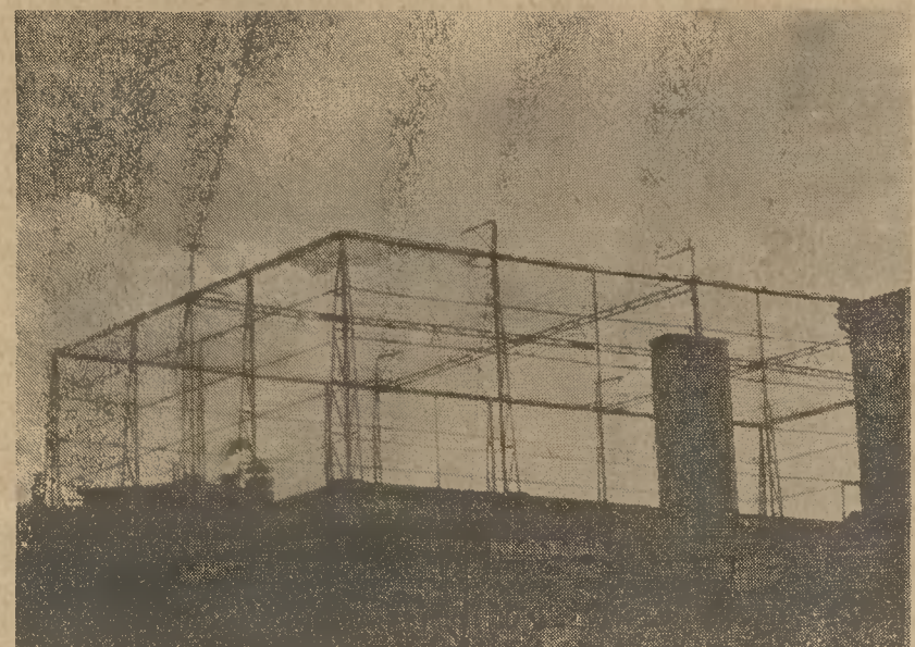
Γενικὴ ἐξωτερικὴ ἀποψὶς τῆς ταράτσας μετὰ τῶν συρματοπλεγμάτων τῆς.

Σήμερον διαθέτομεν οὕτω ἐν τὸς τῶν δύο τούτων ὁρόφων,