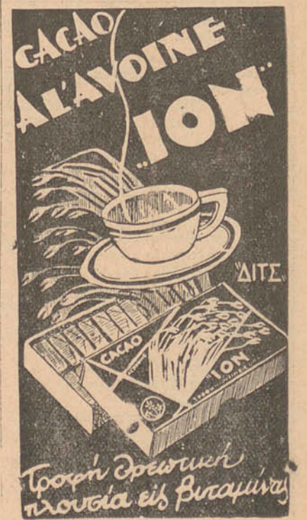
Τροφή θρεπτικὴ πλουσία εἰς βιταμίνης