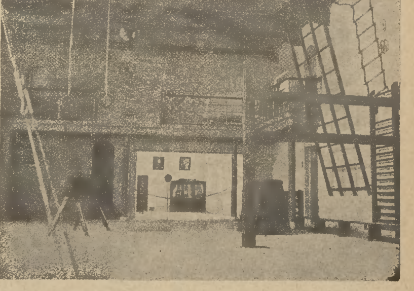
Δυτικὴ πλευρὰ αἰθούσης Γυμναστικῆς. Εἰς τὸ βάθος ἡ αἴθουσα ὀπλομαχικῆς.