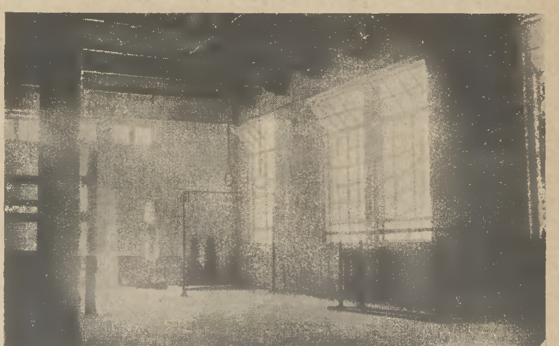
Νοτιανατολική γωνία αἰθούσης Γυμναστικῆς.

ταμετρήσεως ἀρτηριακῆς πίεσεως, καταμετρήσεως ἀναπνευστικῆς ἰκανότητος, δυναμόμετρα κλπ.