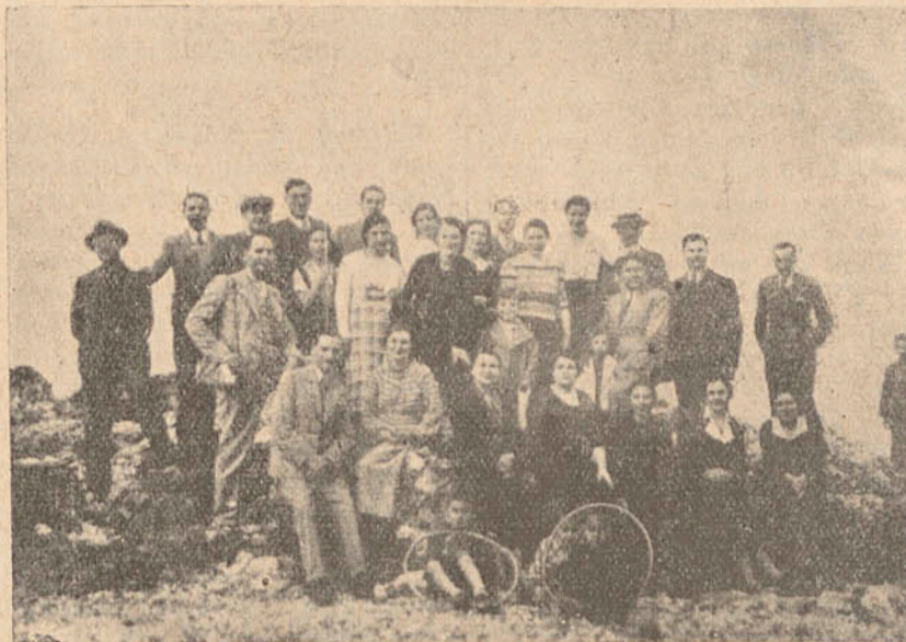
Ἀπὸ τὴν ἐκδρομὴν τῆς 1ης Μαΐου τῶν συναδέλφων τοῦ ὑποκαταστήματος Χανίων.

Εἰς τὰς 9 π. μ. ἐφθάσαμεν εἰς τὸ ἱστορικὸν Κολυμβάρι τῆς Κισσάμου, ἐξαγωγικὸν κέντρον τῆς ἡμισείας ἐπαρχίας Κισσάμου, κτισμένον εἰς τοὺς πρόποδας τῶν ὑψωμάτων τοῦ Ἀκρωτηρίου «Σπάθα».