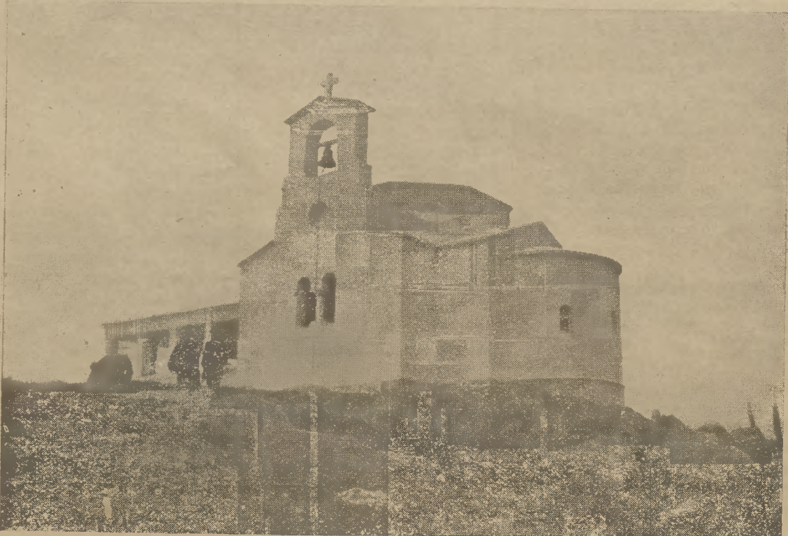
Ὁ Ἱερὸς Ναὸς τῆς ἈΓΙΑΣ ΦΙΛΟΘΕΗΣ, Πολιούχου τοῦ Συνοικισμοῦ τῶν Ὑπαλλήλων τῆς Ἐθνικῆς Τραπεζῆς τῆς Ἑλλάδος, ὁ ὁποῖος, κατ' ἀπόφασιν τοῦ Κοινοτικοῦ Συμβουλίου, θὰ φέρῃ τὸ ὄνομα "ΚΟΙΝΟΤΗΣ ΦΙΛΟΘΕΗΣ,"

Θὰ ληφθῶσι κατόπιν αἱ ἐν τῶν Καθολικῶν μερίδες Ὑποκαταστήματα και Κεντρικοῦ και θὰ σχηματισθῇ κλίμαξ μικτῆς κινήσεως αὐτῶν πρὸς ἐξέυρεσιν τοῦ μέσου ἡμερησίου ὑπολοίπου αὐτῶν και ἂν τοῦτο εἶναι χρεωστικὸν θ' ἀποτελῇ τὸν μέσον ὄρον των εἰς τὸ Κεντρικὸν Κατάστημα διοχετευθέντων κεφαλαίων ἂν δὲ πιστωτικὸν θ' ἀποτελῇ τὸν μέσον ὄρον των ἀντιληθέντων ἀπὸ τὸ Κεντρικὸν Κα-