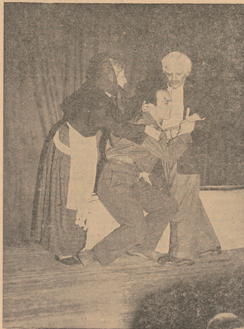
Μία ωραία φωτογραφία ἀπὸ τὴν ἐκτέλεσιν τοῦ πατριωτικοῦ σκέτς ποὺ ἐπαίχθη ἀπὸ συναδέλφους εἰς τὸ Κέντρον Ἀποκαταστάσεως τραυματιῶν κατὰ τὴν ἡμέραν τοῦ εορτασμοῦ τῆς ἑθνικῆς ἐπετείου.

φρασε τὰς ζωηρὰς εὐχαριστίας τῶν νοσηλευομένων διὰ τὴν εὐγενῆ συμπαράστασιν τόσοσ τῆς Ἑθνικῆς Τραπεζῆς, ὅσον καὶ τοῦ Συλλόγου.