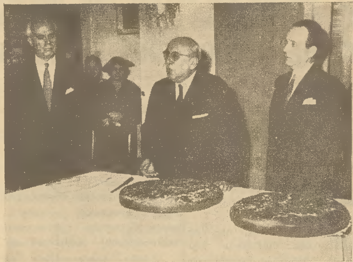
Ἀπὸ τὴν εορτὴν: Ὁ κ. Διοικητὴς ἐν μέσῳ τοῦ κ. Ὑποδιοικητοῦ καὶ τοῦ κ. Προέδρου τοῦ Συλλόγου, ἐκφράζει τὰς εὐχὰς του πρὸς τοὺς παρισταμένους.

Ἀνεφέρθη ἐν συνεχείᾳ εἰς τὰ ἐπίτευγματα τῆς Τραπεζῆς κατὰ τὸ 1958, συγκείμενα τόσο