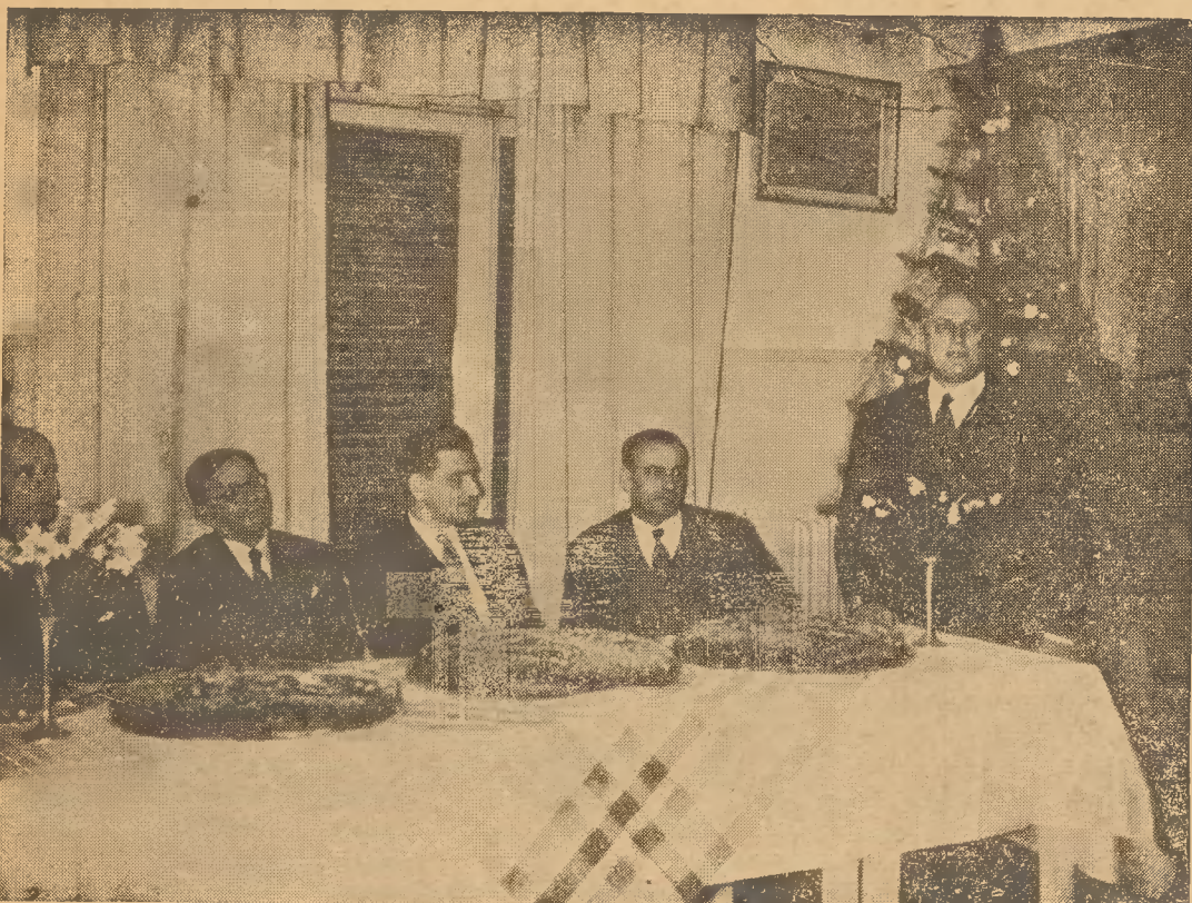
Ο Πρόεδρος του Συλλόγου κ. Κ. Μελισσαρόπουλος προσφωνών τους επισήμους. Έξ άριστερών προς τα δεξιά: Ο Υπουργός κ. Λ. Μπουρνιάς, ο Διοικητής κ. Βασ. Κυριακόπουλος, ο Υπουργός κ. Παν. Παπαληγούρας, ο Γεν. Γραμματεὺς Υπουργείου Έργασίας κ. Κ. Χρυσανθόπουλος και ο όμιλῶν Πρόεδρος