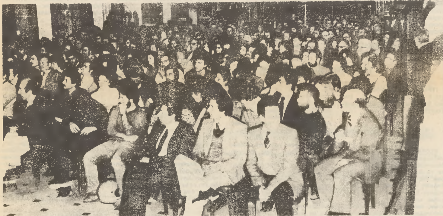
Γενική άποψη της Συνέλευσης