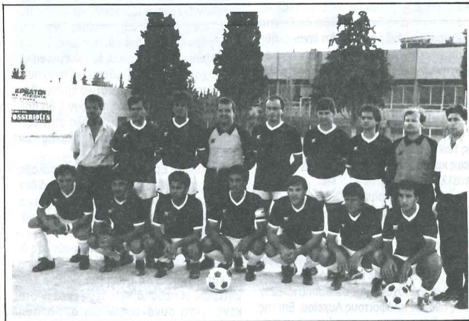
— Η Ομάδα του ΣΥΕΤΕ, δεύτερη στο Πρωτάθλημα Ποδοσφαίρου της Ο.Τ.Ο.Ε.