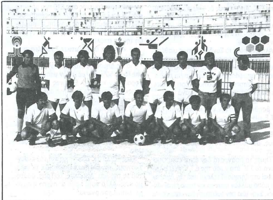
— Η Πρωταθλήτρια και Κυπελλούχος ομάδα του ΤΥΠΕΤ

Πιθανόν μερικές φορές να υπάρχει η αντίληψη από μερικούς, ότι ο ΣΥΕΤΕ δεν ενδιαφέρεται για τα διάφορα προβλήματα που προέκυπταν. Ίσως και να έχουν δίκιο. Η πραγματικότητα όμως είναι άλλη. Αν και υπάρχουν διάφορα προβλήματα ο ΣΥΕΤΕ θα βρίσκεται πάντα δίπλα τους σε ότι ζητήσουν. Βέβαια καλό θα είναι να ενεργοποιηθούν όλοι οι συν/φοι που ασχολούνται και θα ήταν ευχάριστο να βλέπαμε ενδιαφέρον και στην επαρχία.