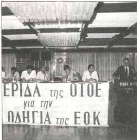
Ημερίδα για την 2η οδηγία της ΕΟΚ οργάνωσε η ΟΤΟΕ με τη συμμετοχή Ευρωβουλευτών, Επιστημονικών και Επαγγελματιών Οργανώσεων, κ.α. Τα πολύ ενδιαφέροντα πράγματα υλικά θα εκδοθούν. Στη φωτογραφία φαίνεται στο βήμα ο υφυπουργός Θ. Καρατζός