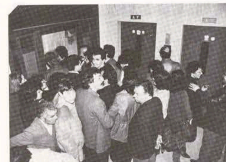
Ενα ακόμη στιγμιότυπο που δείχνει την αθρόα συμμετοχή των συναδέλφων στην ψηφοφορία