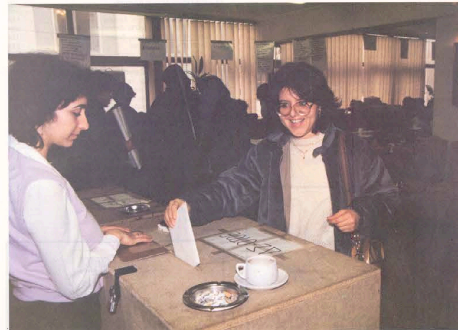
Ενα στιγμιότυπο από την ψηφοφορία για την ανάδειξη οργάνων στο ΣΥΕΤΕ που έγινε με υποδειγματικό τρόπο και με μεγάλη συμμετοχή συναδέλφων