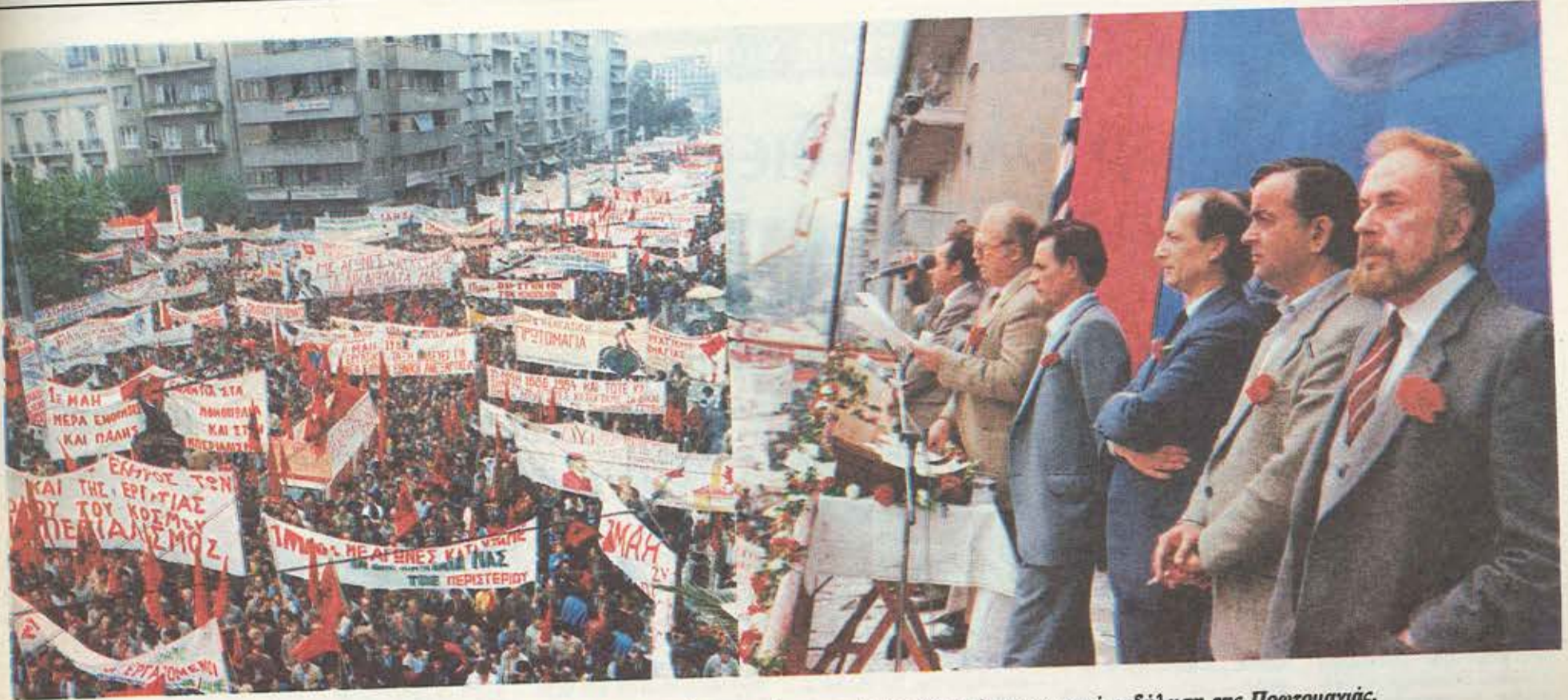
Ανεπανάληπτη σε μαζική συμμετοχή, ενθουσιασμό και μηνύματα ταξικής πάλης ήταν η φετινή εκδήλωση της Πρωτομαγιάς.