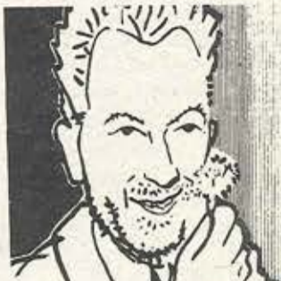
Το γνωστό σκίτσο του Πικάσσο: ο άνθρωπος με το γαρούφαλλο.

Η «Τραπεζιτική» παρουσιάζει με υπερηφάνεια αυτή τη συνέντευξη, που παρόλο τον κάποιον φυσιολογικό υποκαμεινισμό της, αποτελεί μαρτυρία μιας μαύρης εποχής για τη χώρα μας, που παραμένει ζωντανή στη μνήμη του λαού μας.