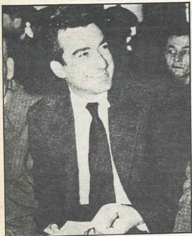
Μάρτης 1952: ο Νίκος Μπελογιάννης χαμογελαστός στη διάρκεια της δίκης του.

Σε πήραν μέσ' τη νύχτα με βιασύνη στο πρόσωπό σου πανανθρώπινη γαλήνη Με σφαίρες των Τζέιμς σου τρυπήσανε τα στήθια στα σκοτεινά οι σκοτεινοί κτυπήσαν την αλήθεια μα κάθε σφαίρα που τρυπούσε το κορμί σου δυνάμωνε τους ήχους της καρδιάς και της φωνής σου. Και ο αντίλαλός της πανώριο προσκλητήριο, άφθαστος τόλμης, σύντροφων εγερτήριο. Τον πόνο σας αδεργωτά κρατείστε μία χάρη σας ζητώ συνεχίστε