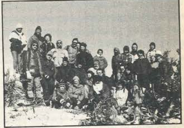
Είναι οι συνάδελφοι που ανταποκριθήκαν θερμά στο κάλεσμα των υπεύθυνων του Φυσιολατρικού κι ανέβηκαν στις 15/1/84 στη χιονισμένη κορυφή του Κιθαιρώνα (1409μ.). Τα χαμογελαστά πρόσωπά τους, παρά το κρύο και το δυνατό αέρα, δείχνουν ότι κυριολεκτικά «πτιάνε στα σύννεφα».