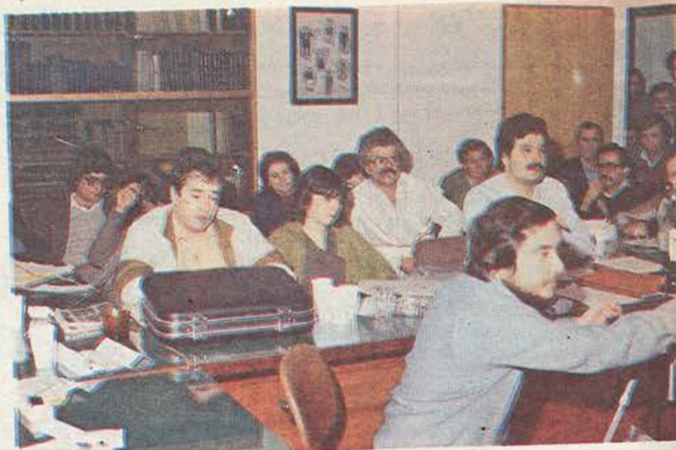
Στιγμιότυπα από τη συνεδρίαση του ΔΣ του ΣΥΕΤΕ της 25 Απριλίου 1984

κλήρωση του εκδημοκρατισμού του σ.κ. ώστε να εκφράζεται σ' όλα τα επίπεδα συνδικαλιστικής οργάνωσης η ανόθευτη θέληση των εργαζομένων, να καταργηθούν οι μηχανισμοί παρέμβασης στο συνδικαλιστικό κίνημα, να κατοχυρωθούν οι Διεθνείς συμβάσεις εργασίας, να καταργηθούν τα υπολείμματα της αντεργατικής νομοθεσίας, να γίνει ένα σωματείο σε κάθε χώρο δουλειάς. η) Την παρέμβαση του συνδικαλιστικού κινήματος στην Εθνική Τράπεζα σε γενικότερα ζητήματα που επιδρούν έτσι ή αλλιώς στην εργατική τάξη, όπως είναι τα μεγάλα θέματα της ειρήνης και εθνικής ανεξαρτησίας.