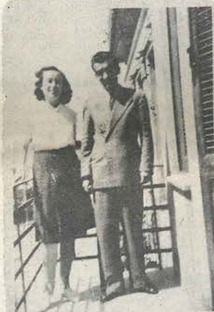
Αριστερά: Η Ορσα κι ο Νίκος Μπελογιάννης τον πρώτο καιρό της γνωριμίας τους, τον Ιούνιο 1946. Δεξιά: η Ορσα στην εξορία, μαζί με μια συναγωνίστρια, γύρω στα 1950.