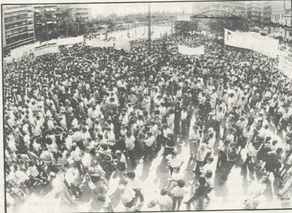
Βλέπουμε τη συμμετοχή μας στις Γνωμοδοτικές σαν ένα ακόμα πεδίο ταξικής πάλης κι όχι σαν μια ακόμα πρόφαση ταξικής συνεργασίας.

γ) της κατηγορίας 3 από τα Διοικητικά Συμβούλια των οικείων κοινωνικών φο- ρέων (ΚΕΔΚΕ, ΓΣΕΕ, ΠΑ- ΣΕΓΕΣ, ΟΕΕΕ και ΣΕΒ) πλήν των εκπροσώπων των εργαζόμενων στις αναφερό- μενες τράπεζες που εκλέ- γονται με καθολική μυστική ψηφοφορία και με το σύστη-