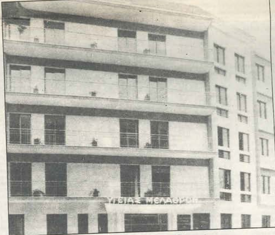
Η κλινική του ΤΥΠΕΤ κοντά στο Πεδίο του Αρεως.

Μόνο μ' αυτές τις προϋποθέσεις μπορούμε να επανορθώσουμε την αδυναμία της ΟΤΟΕ να δώσει με αγώνα ασφαλή απάντηση σ' αυτό το κρίσιμο πρόβλημα.