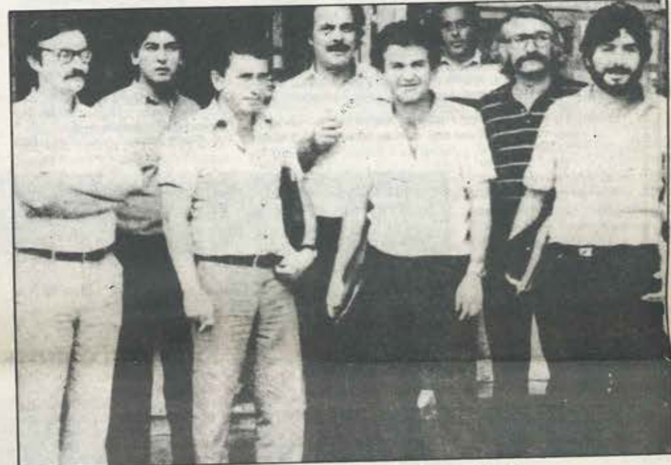
Η διορισμένη Οργανωτική Επιτροπή για το Συνέδριο.

Μόνο η συλλογική δράση στα πλαίσια των αποφάσεων των συλλογικών μας οργάνων (Σ.Υ.ΕΤΕ-ΟΤΟΕ) με το συντονισμό και την οργανωμένη δράση θα δώσει διέξοδο στα προβλήματά μας.