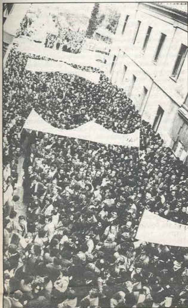
Η φωτογραφία αυτή θυμίζει σίγουρα «άλλες εποχές». Πράγματι, τραβήχτηκε στις 4 Οκτώβρη 1980. Όμως, «άλλες εποχές» θυμίζει κι η φετινή στάση της κυβέρνησης και της εργοδοσίας απέναντι στα δίκαια αιτήματά μας, που υποβλήθηκαν στη ΣΣΕ '83.

γ. επιχειρεί να επιβάλλει ρυθμίσεις ερήμην των συνδ/κών Οργανώσεων (η σχετική απόφαση του Γεν. Συμβουλίου - ανακοίνωση 71/5.8.83 - καλύ-