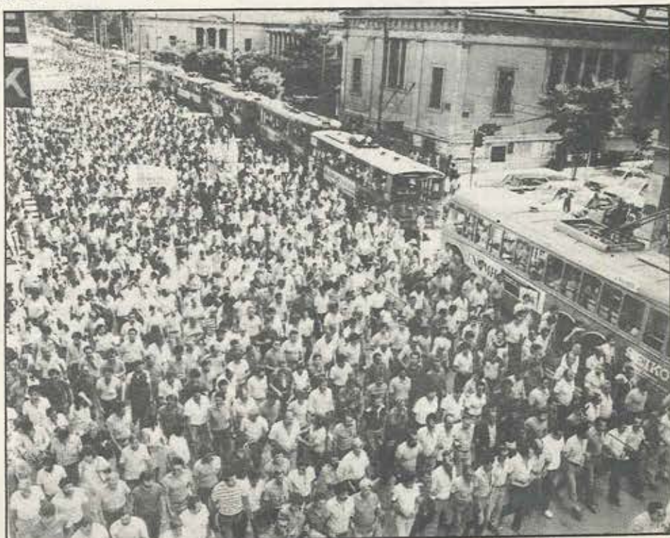
Οι εκλεγμένοι αντιπρόσωποι των εργαζόμενων στις Τράπεζες δεν θα παίζουν διακοσμητικό ρόλο μέσα στις Γνωμοδοτικές Επιτροπές.

Οι εξελίξεις είναι πολύ σοβαρές. Σε τόσο βαρύνοντα ζητήματα όπως τροποποίηση οργανισμών, προσανατολισμός του τραπεζικού συστήματος κλπ, κλπ δεν μπορούμε να περιοριστούμε στην έκφραση της γνώμης μας. Εχουμε ήδη τα πρώτα δείγματα από την κυβερνητική πλευρά, στο πώς κατανοεί τη ΣΥΜΜΕΤΟΧΗ ΤΩΝ ΕΡΓΑΖΟΜΕΝΩΝ