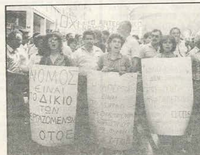
Όσοι νόμισαν πως με το άρθρο 4 και τις Γνωμοδοτικές βρήκαν την «κότα με το χρυσό αυγό» για την αναστολή κάθε διεκδικήσεώς μας, θα διαπιστώσουν σύντομα πόσο λάθος έκαναν...

—Αντί να υιοθετηθούν οι ρεαλιστικές προτάσεις του ΔΣ και να