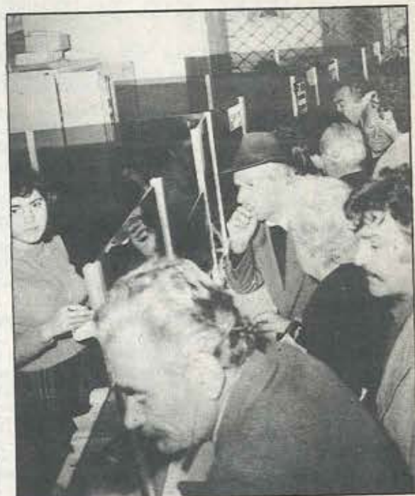
Πώς εξηγείται το φαινόμενο να μην πηγαίνουν οι νεοπροσλαμβανόμενοι στις θέσεις που υπάρχουν πραγματικές ανάγκες; Ας μας απαντήσουν τα τετράγωνα κεφάλια της Διεύθυνσης Προσωπικού...

— ΤΗ ΣΥΜΜΕΤΟΧΗ ΜΑΣ ΚΑΙ ΣΤΟ ΔΙΟΙΚΗΤΙΚΟ ΣΥΜΒΟΥΛΙΟ ΤΗΣ ΤΡΑΠΕΖΑΣ ΘΑ ΤΗΝ ΚΑΝΟΥΜΕ ΟΥΣΙΑΣΤΙΚΗ.