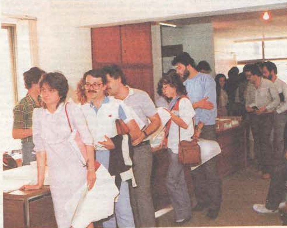
Μετά την έγκριση του νέου καταστατικού κατοχυρώνονται και τυπικά οι επιτροπές καταστημάτων και τα περιφερειακά όργανα του ΣΥΕΤΕ. Οι εκλογές θα γίνουν ταυτόχρονα για όλα τα καταστήματα, μέσα στον Οκτώβρη. Στο ίδιο διάστημα, στις 6-7-8 Οκτώβρη, θα εκλέξουμε από 2 εκπροσώπους για το Διοικητικό Συμβούλιο της ΕΤΕ και 3 εκλεκτούς για τις Γνωμοδοτικές Επιτροπές του Ν. 1365/83, με το σύστημα της απλής αναλογικής.