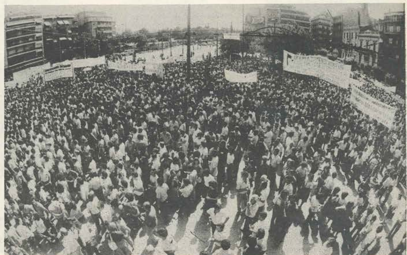
27 Μάη 1983:

Μπροστά στα γραφεία της ΓΣΕΕ οι εργαζόμενοι απαιτούν ενεργητική συμπαράσταση της ανώτατης συνδικαλιστικής τους οργάνωσης στον αγώνα για εφαρμογή φιλολαϊκών μέτρων από τη σημερινή κυβέρνηση.