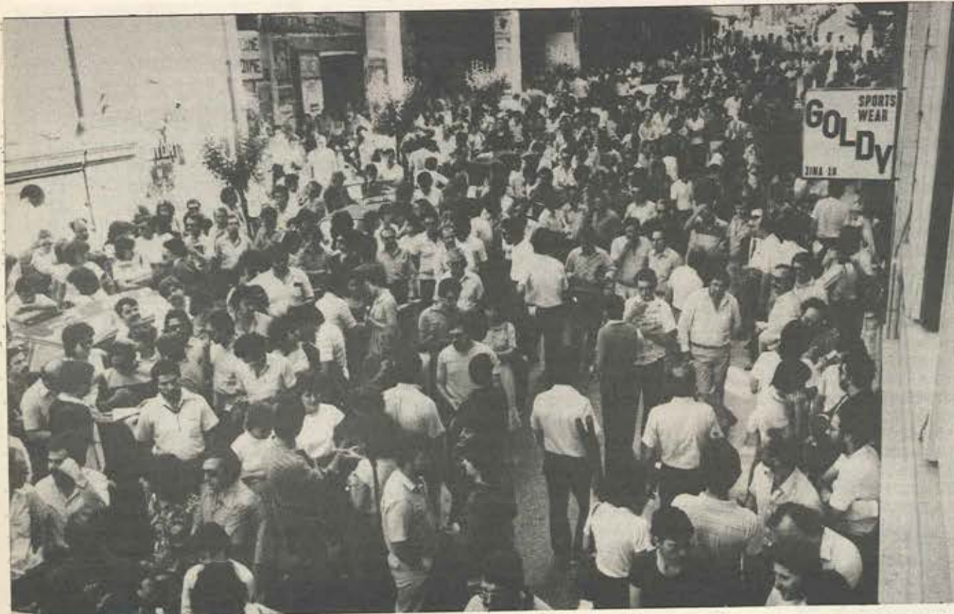
26 Μάη 1983: Μια ακόμα μαζική συγκέντρωση τραπεζοϋπαλλήλων θα 'ρχίσει σε λίγο στη Σίνα 16.

μενων στην άσκηση της διοίκησης των Τραπεζών. Στην κατεύθυνση αυτή ζητούμε: