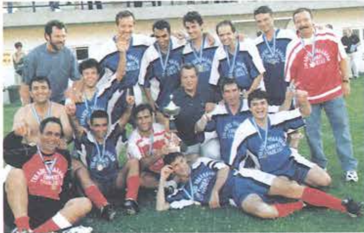
Η πρωταθλήτρια ομάδα του ΣΥΕΤΕ στο διατραπεζικό πρωτάθλημα της ΟΤΟΕ

Η παρουσία της ομάδας μας ήταν θετικότερη καθώς κατέκτησε το διατραπεζικό πρωτάθλημα επικρατώντας της ομάδας της Ιονικής Τράπεζας με 2-1.