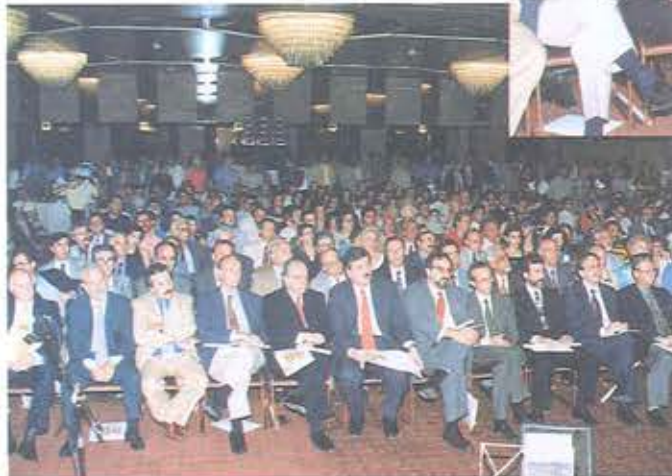
Γενική άποψη από την εκδήλωση για τα 80χρονα

μιουργίας - Κατακτήσεων" έγινε σε κεντρικό ξενοδοχείο της Αθήνας με τη συμμετοχή μεγάλου αριθμού συναδέλφων, του υφυπουργού Εργασίας Χρήστου Πρωτόπαπα και του διοικητή της ΕΤΕ Θεόδωρου Καρατζά.