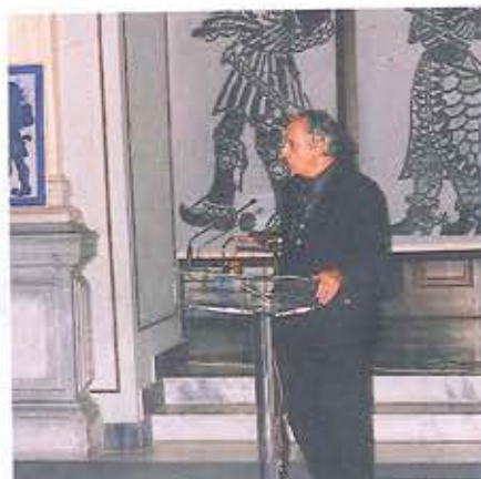
Ο Λογοτέχνης Βουλευτής κ. Τηλ. Χυτήρης