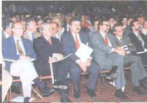
Ο Υφυπουργός Εργασίας συν. Χρ. Πρωτόπαπας με τον Διοικητή και τους Υποδότες της ΕΤΕ