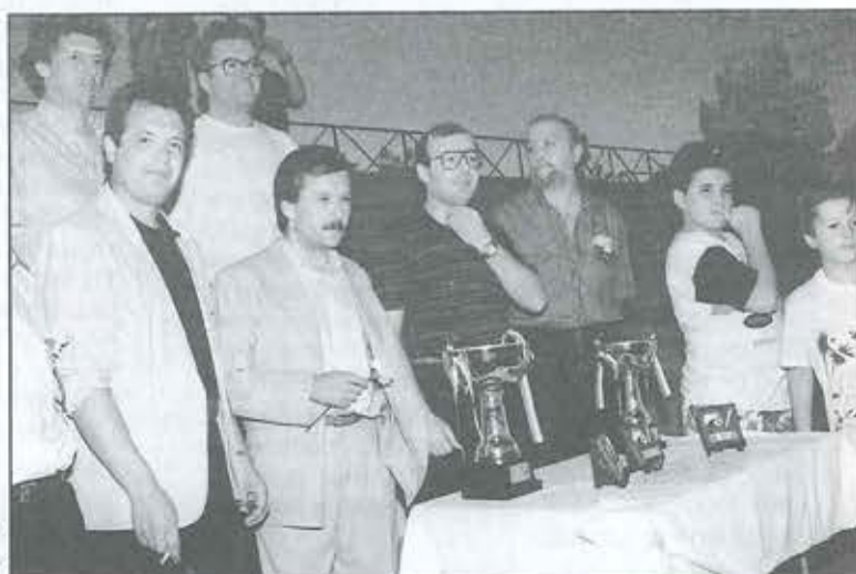
Από την απονομή των επάθλων