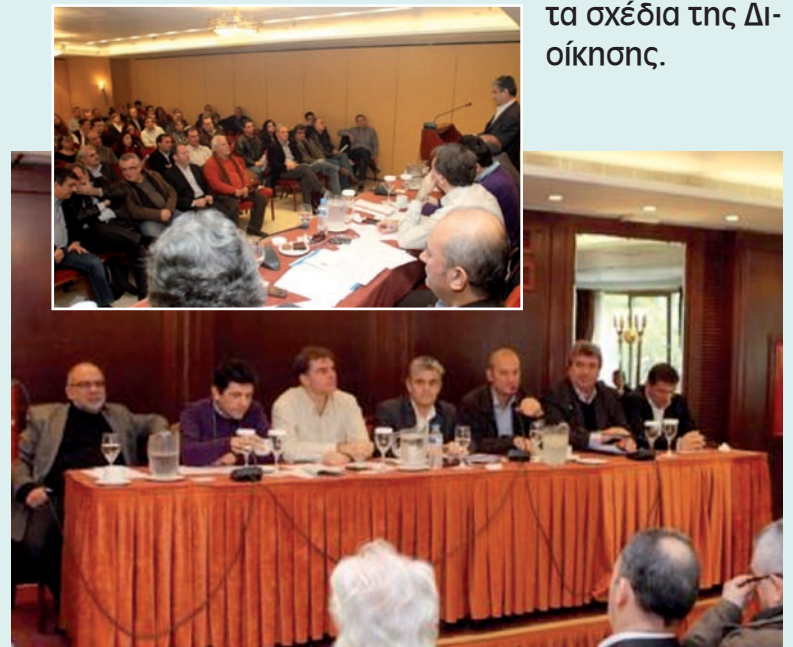
Πανελλαδικό Συμβούλιο & Εκθεσιακό Κέντρο, Κοίτη Κοζάνης