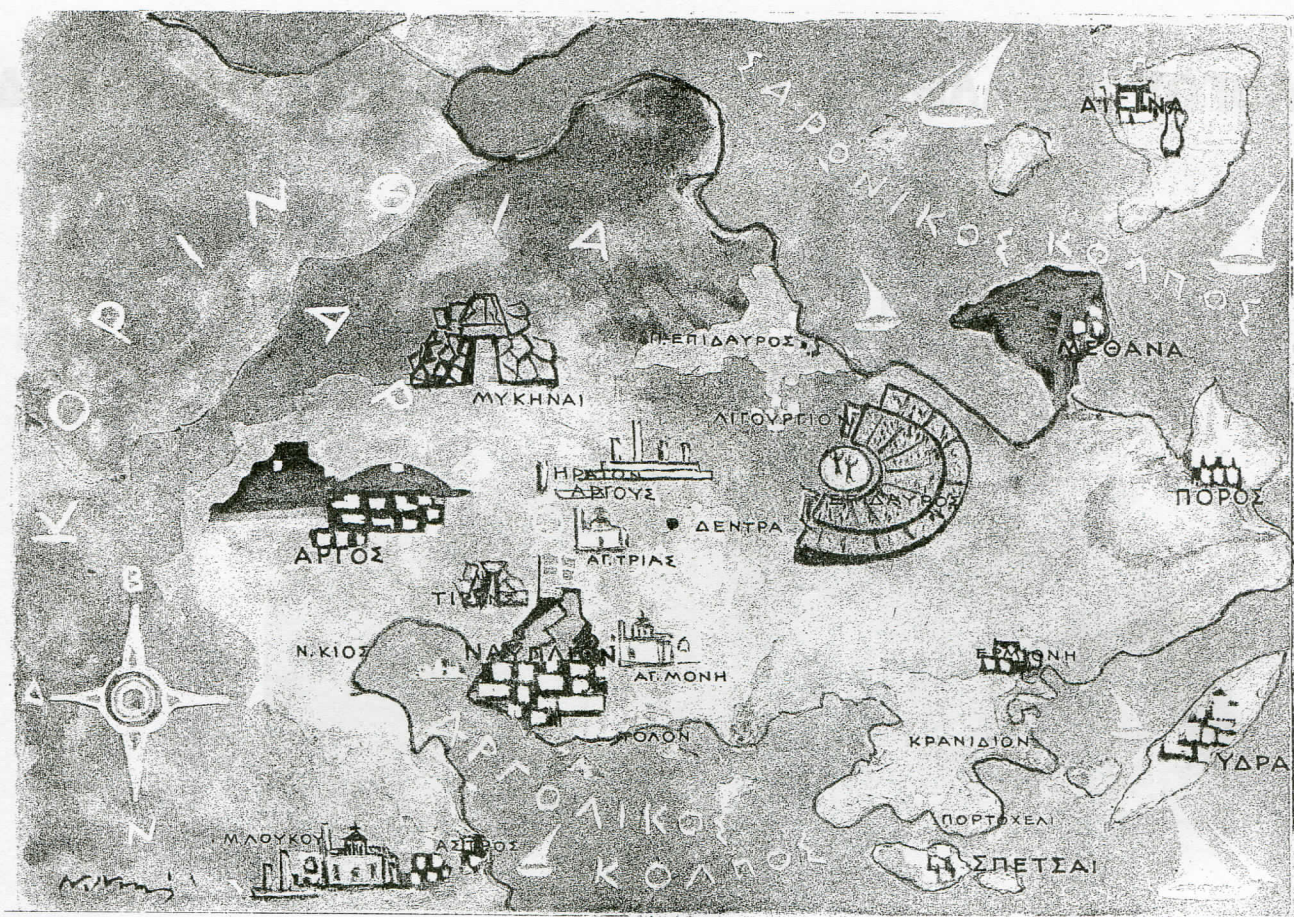
Χάρτης της Αργολίδας: έργο του Νίκου Νικολάου