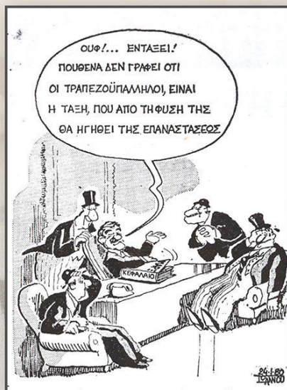
Οι δυναμικές, πολυήμερες κινητοποιήσεις των εργαζομένων στις τράπεζες για το ωράριο είχαν κάνει μεγάλη εντύπωση σε ολόκληρη την ελληνική κοινωνία, ενώ ο τύπος αφιέρωνε καθημερινά σελίδες ολόκληρες στο θέμα. Στις φωτογραφίες, γειογραφίες στον ημερήσιο τύπο της εποχής από τους σπουδαίους γειογράφους Γ. Ιωάννου και Γ. Καλαϊτζή.