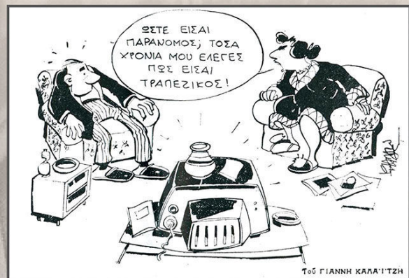
Το © ΓΙΑΝΝΗ ΚΑΛΑΪΤΖΗ