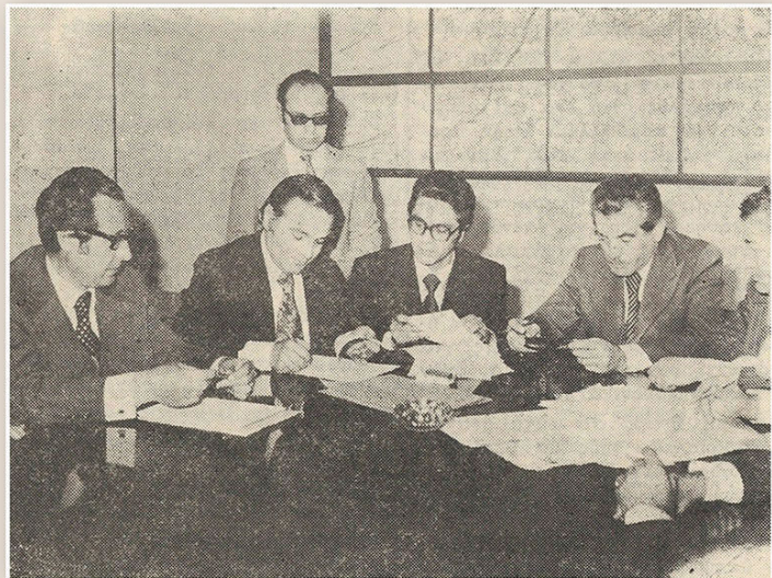
Ο πρόεδρος του ΣΥΕΤΕ και γεν. γραμματέας της ΟΤΟΕ Παν. Θεοφάνη υπογράφει στη νέα κλαδική συλλογική σύμβαση εργασίας. Διακρίνονται δεξιά του ο πρόεδρος της ΟΤΟΕ Θ. Παπαμάργαρης και ο υπουργός Εργασίας Κ. Λάσκαρης. Εφ. Τραπεζική, φ. 365/ Απρίλιος 1976.