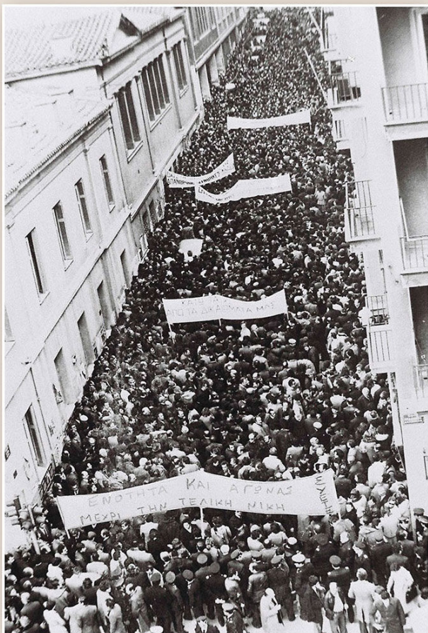
Φωτογραφίες από την πρώτη φάση της μεγάλης απεργίας της ΟΤΟΕ για το ωράριο, Ιούλιος 1979.